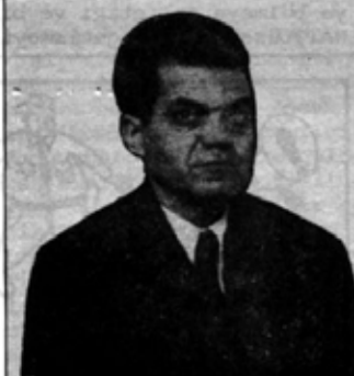
Faşizmle mücadele döneminde R. Fuat Baraner

Bugün, Türkiye Devrim Hareketinin büyük savaşçısı Reşat Fuat Baraner'i minnetle anıyoruz.